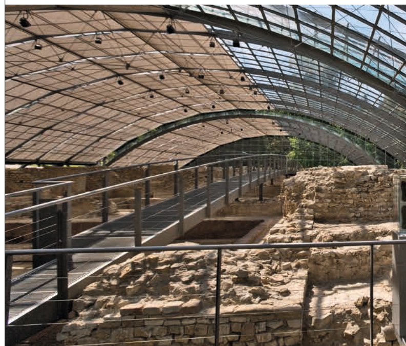
Des passerelles enjambent les vestiges des bains romains qui sont les mieux conservés au nord des Alpes

À droite : une exposition informative et claire accompagne la visite à travers les vestiges des thermes et leur héritage culturel