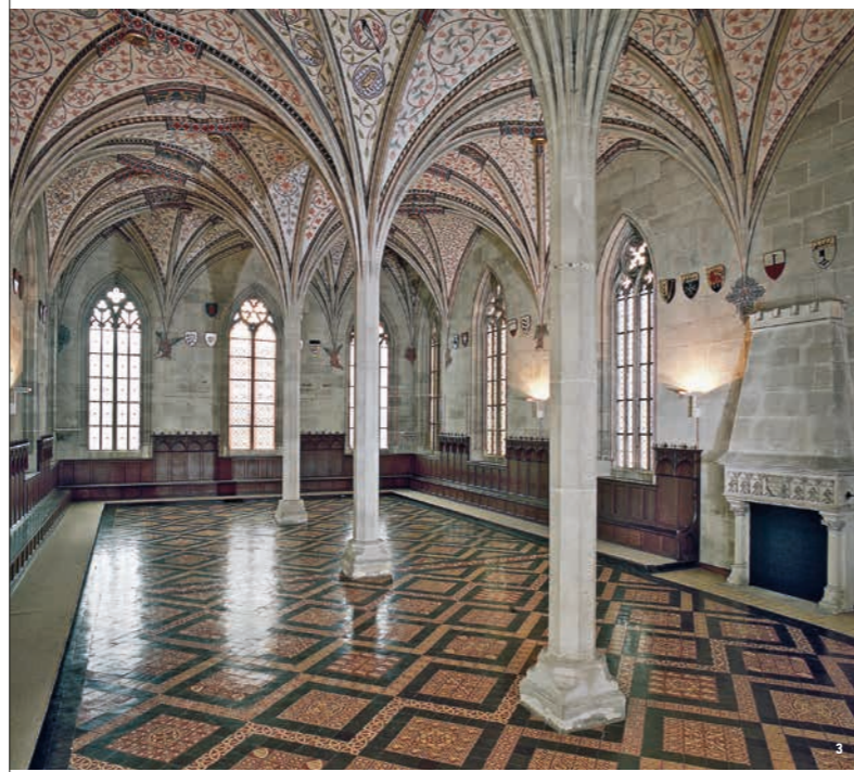
🏰👑 Le réfectoire d'été des moines représente le gothique dans son style le plus élégant

Le monastère du Moyen-âge de Bebenhausen se situe dans le paysage légèrement vallonné de Schönbuch. Certaines parties du monastère ont été transformées en pavillon de chasse royal au XIXe siècle.