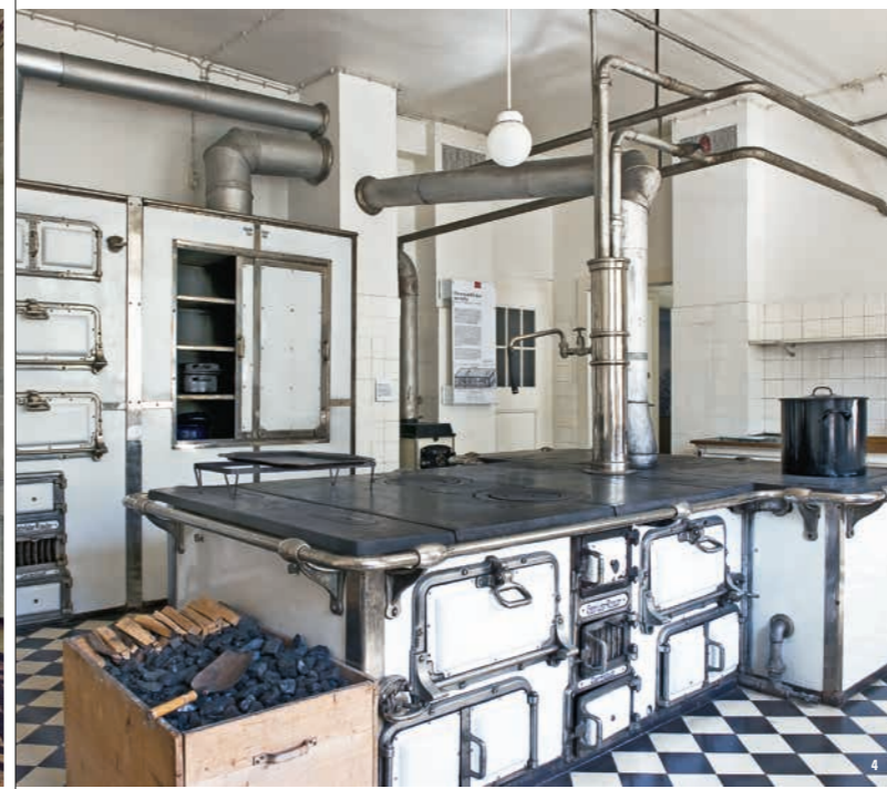
🏰👑 La cuisine du château date de l'époque du dernier couple royal

À la fin de la monarchie en 1918, le couple royal de Wurtemberg, Charlotte et Guillaume II, bénéficie d'un droit de résidence à vie à Bebenhausen. La salle de bain et la cuisine sont des reliques qui méritent le détour : la salle de bain de 1915 totalement conservée est un exemple unique d'aménagement original du plus haut niveau. En 1915, la cuisine du château a été rénovée selon les normes les plus modernes et fonctionne encore aujourd'hui.