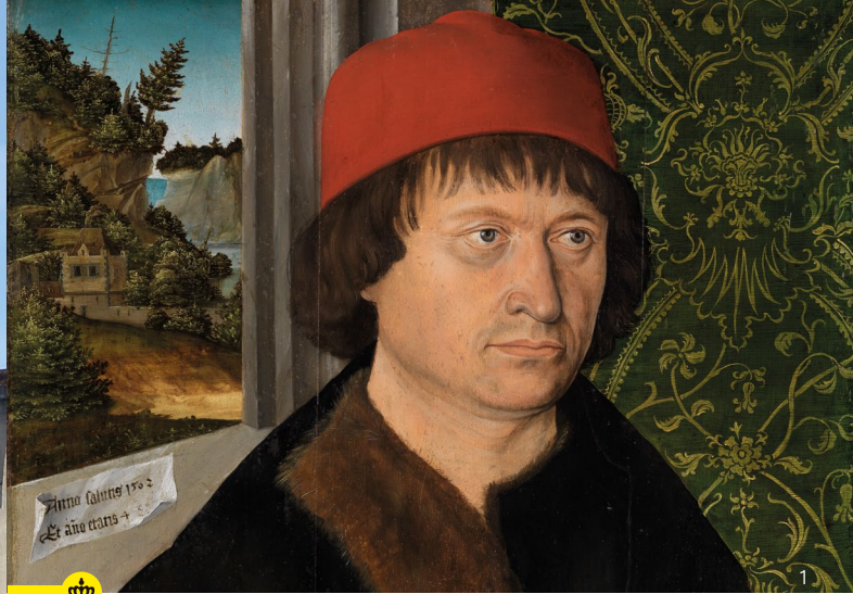
Bildnis des Konstanzer Bischofs Hugo von Hohenlandenberg, 1502, Staatliche Kunsthalle Karlsruhe

Vor 500 Jahren verließ Bischof Hugo von Hohenlandenberg (1457–1532) mit seinem Hof die Bischofsstadt Konstanz und zog ans gegenüberliegende Bodenseeufer. Meersburg wurde damit auf einen Schlag zur Residenzstadt.