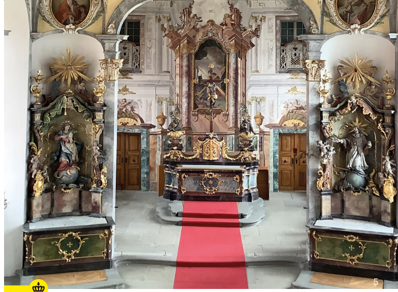
Seminarkapelle Karl Borromäus