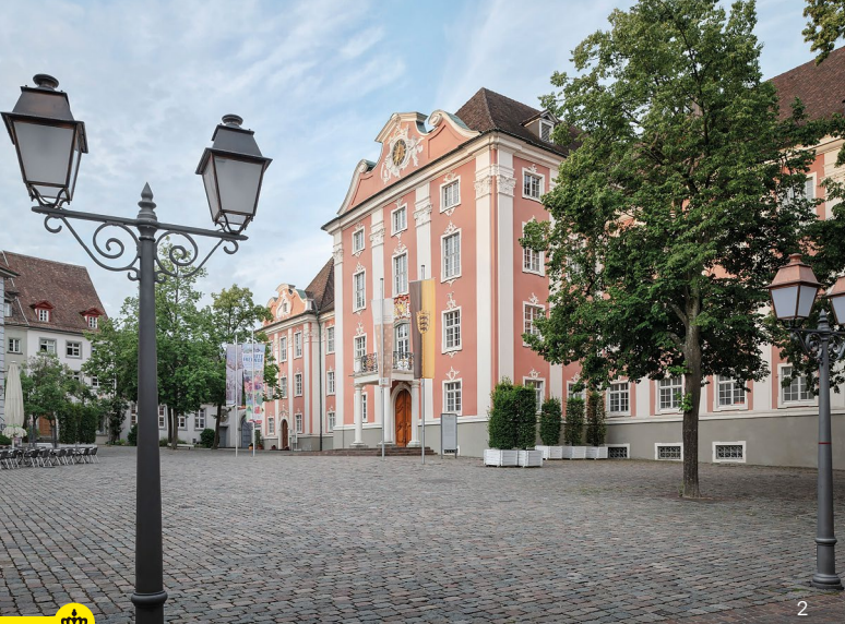
Blick über den Schlossplatz auf das Schloss