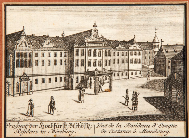
Guckkastenbild von Schloss Meersburg, 2. Hälfte des 18. Jhs.