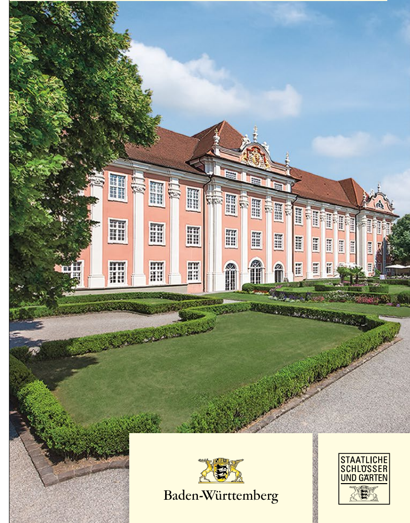
设计理念: www.jungkommunikation.de